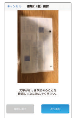
【2】文字がはっきり読めることを確認して次に進んでください。