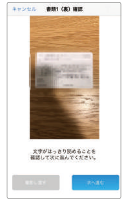
【2】文字がはっきり読めることを確認して次に進んでください。