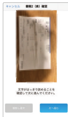
【2】文字がはっきり読めることを確認して次に進んでください。