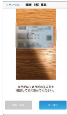
【2】文字がはっきり読めることを確認して次に進んでください。